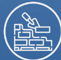
Construcción en ladrillo rojo recocido