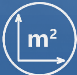
114.00 m 2