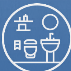
2 baños (1 en habitación principal)