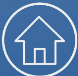
98.93 m 2