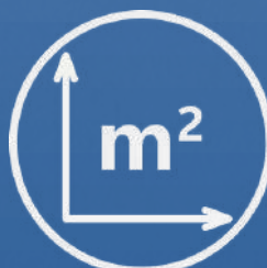
114.00 m 2