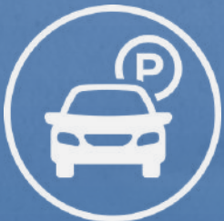
Espacio para 2 autos