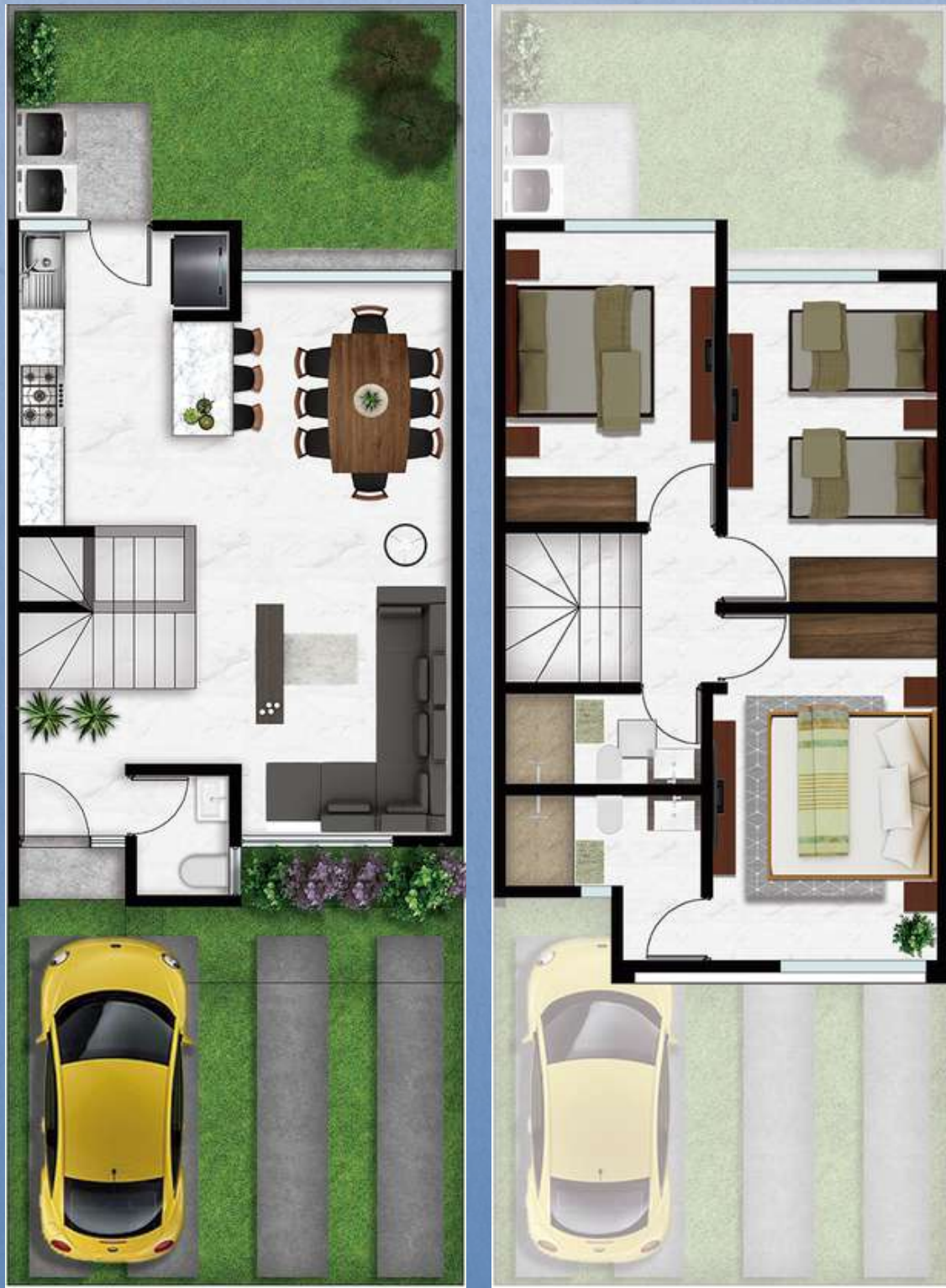
Los metros de construcción pueden variar según el Fraccionamiento. Uso ilustrativo