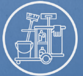
Patio de Servicio