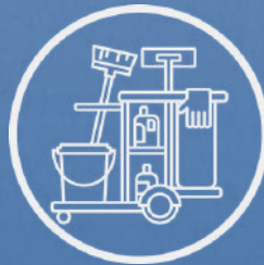
Patio de Servicio