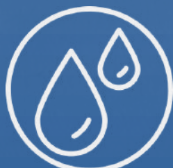
Casas con Tinaco de 750 lts y Cisternas de 2800 lts