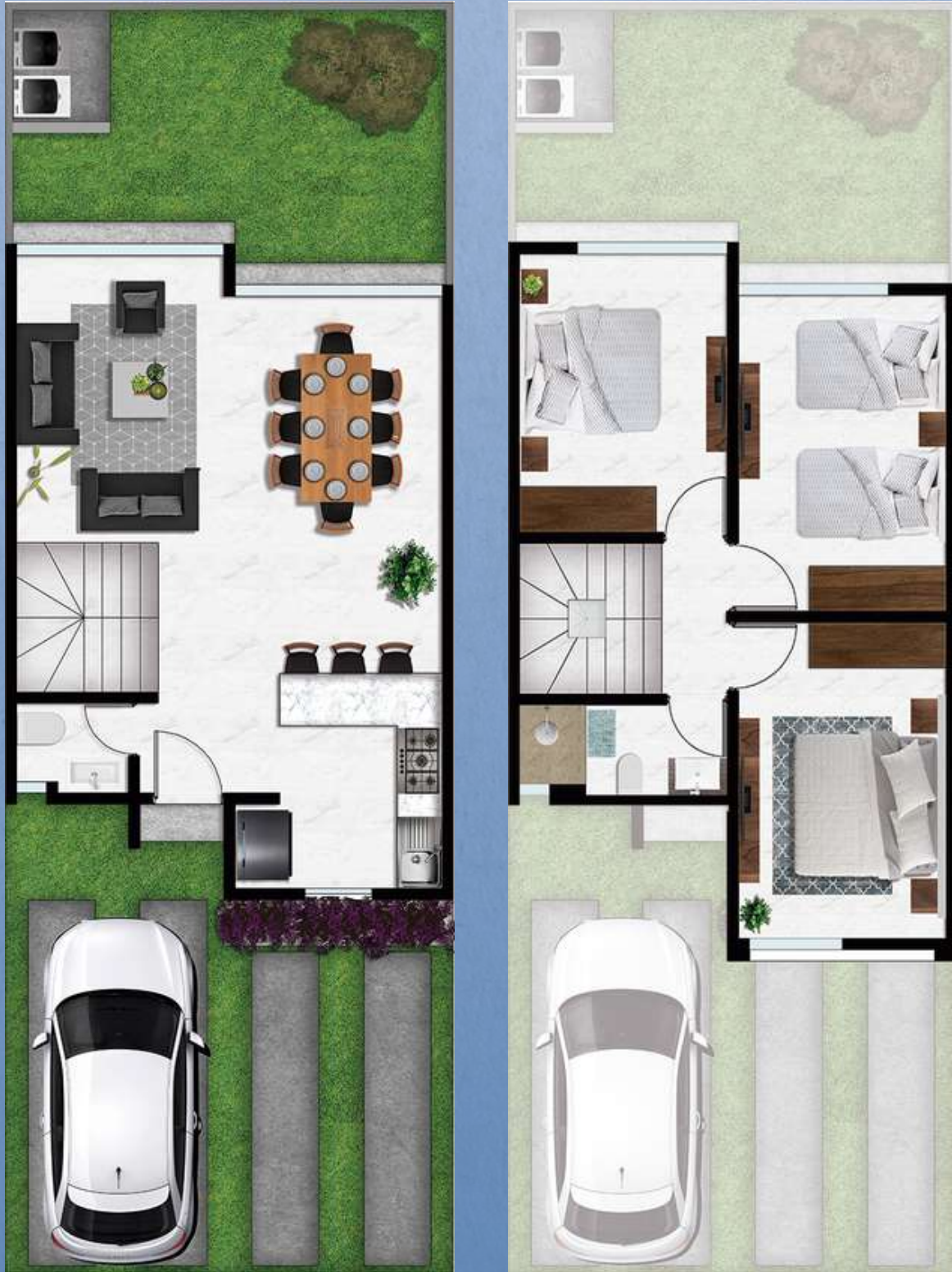
Los metros de construcción pueden variar según el Fraccionamiento. Uso ilustrativo