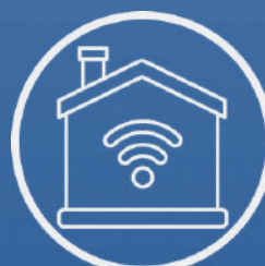
Opción de Smart Home*